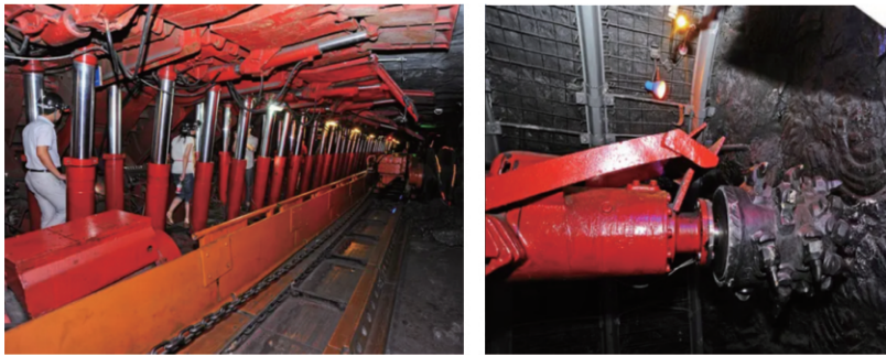
图 10 采掘现场体验区 Fig. 10 Mining site experience area

8)采掘现场体验区。拟在 840 水平正前区域建设 3 个采掘现场体验区,并展示采煤设备,适合从业人员、学生等感兴趣群体,参观和亲自体验。3 个采掘现场体验区包括开拓工艺体验区、掘进工艺体验区、回采工艺体验区。以上 3 个区域需设专职培训师管理,行人进入体验区后,若有意亲身体会,需进行快速、简易培训,在专职培训师监管下方可进行开机体验。待游人培训完毕后,可前往 840 水平行人斜井乘坐架空乘人装置(猴车)升井,如图 10 所示。