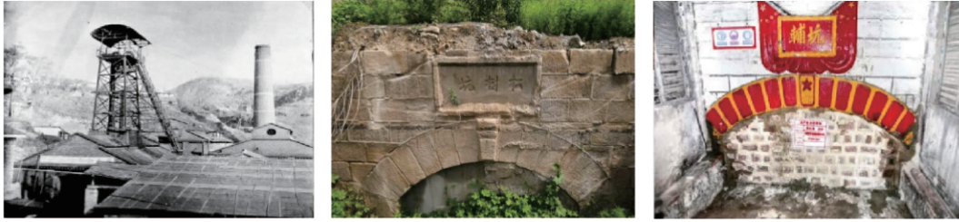
图 1 白家庄矿井工业遗产

时期典型的建筑物展现了矿山发展历史、煤炭综合利用的过程,推动矿山工业旅游发展。图 1、图 2 为白家庄矿井和地面的工业遗产。