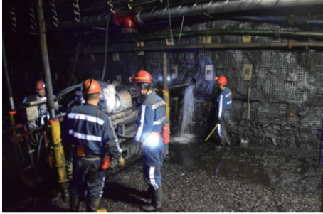
图 8 原位实验测试过程 Fig. 8 In-situ test process

室内无法进行的实验测试内容,同时帮助游客了解采矿生产及科研活动实施情况。此外,还可以采用智能演示仪为游客展示矿井空间不同历史时期的变化,全方位了解矿井开采的整个过程,如图 8 所示。