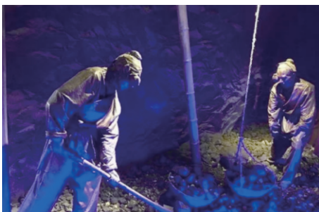
图4 人工采煤工艺展示

2) 采煤工艺进化区。从矿业文化展览区走出后,行人可步入采煤工艺进化区,对煤炭工业进行初步了解,沿途观赏从古至今煤炭开掘工艺,从人力化、机械化、自动化向智能化转变,感受传统煤炭工业与现代智能化工业的碰撞,如图4所示。