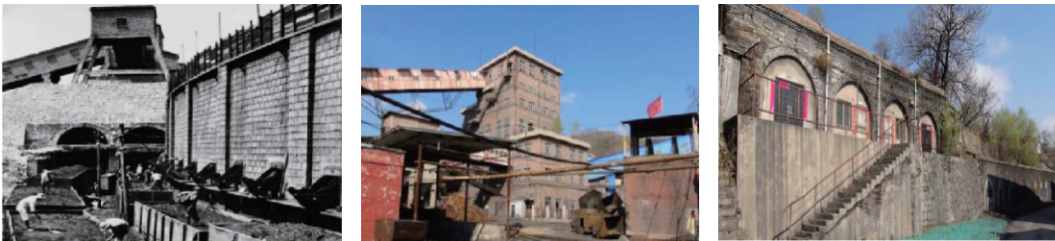
图 2 白家庄地面工业遗产