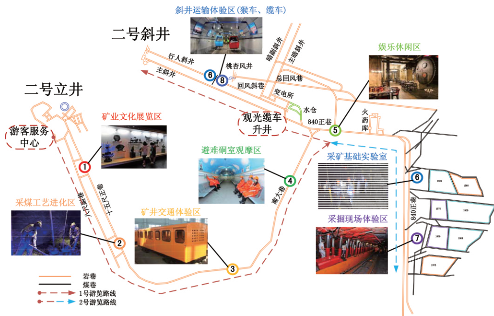
图12 2#井旅游设计方案

个智能采矿实训实践基地,清晰呈现智能采矿过程,为这类未来智能采矿工程师们提供真实、全面及安全的学习平台,将实习与游览相结合,增强实习体验,珍惜劳动成果,强化安全教育。实训学生路线从游客服务中心行至智能矿井指挥控制中心,进行系统的专业指导和学习,最后进行实验或者实训演练。