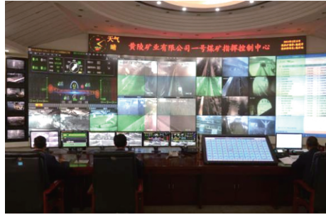
图 9 智能矿井指挥控制中心 Fig. 9 Intelligent mine command control center

7)智能矿井指挥控制中心。智能矿井指挥控制中心能够实现矿井下采煤、掘进、运输各个生产环节清晰映射。作为矿井安全运行指挥中枢,各系统数据传输的稳定性非常重要。该体验项目非常适合实训学生参观和学习,便于充分了解现场情况,如图 9 所示。